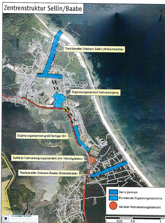
Abbildung 3 Zentrenstruktur im Grundzentrum Sellin/Baabe (Dr. Lademann & Partner 2013)