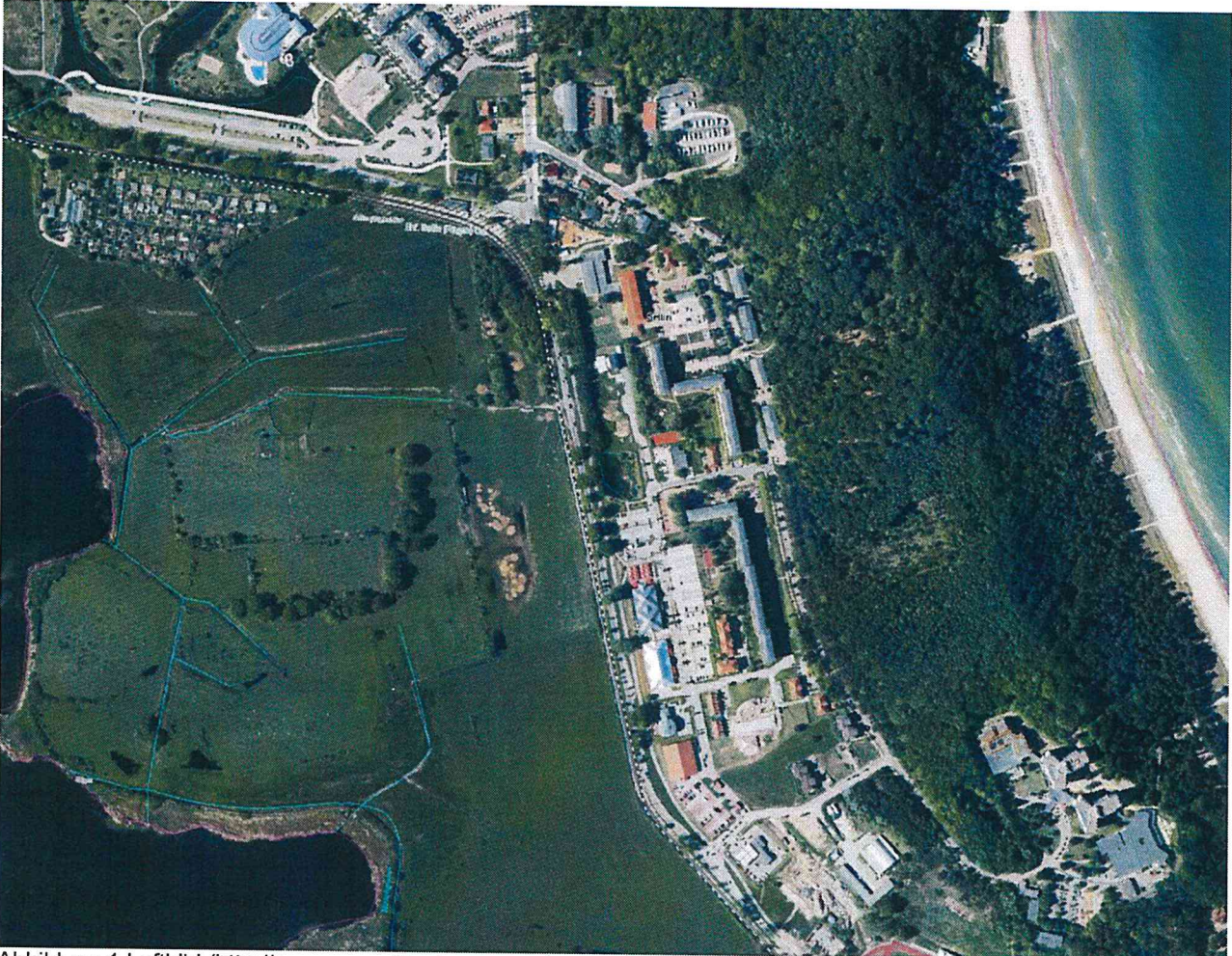
Abbildung 1 Luftbild ( http://www.umweltkarten.mv-regierung.de )

Das Plangebiet umfasst das bestehende Fachmarktzentrum (Kaufhaus Stolz) mit den Flurstücken 140/37, 140/1, 139/3, 139/2, 139/18, 139/23 (teilw.), 140/14 (teilw.), sämtlich Flur 4, Gemarkung Sellin sowie den dazwischenliegenden Anteilen der Friedrich-von-Hagenow-Straße (Flst. 139/20 (teilw.), 139/21 (teilw.), 140/38 (teilw.)) mit zusammen ca. 1,2 ha.